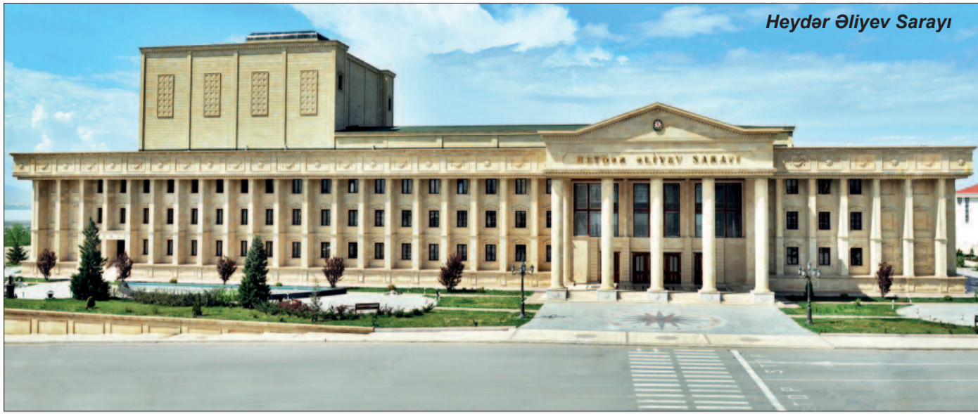
Heydər Əliyev Sarayı